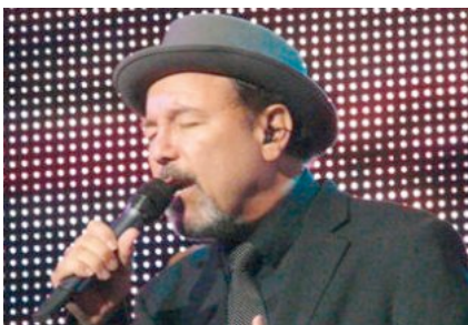
Una vida en el escenario. la cartelera.

Eduardo Guillot Es un icono en el ámbito de la cultura de habla hispana, y uno de los grandes renovadores de la salsa desde su primera grabación, en 1967. Después de ejercer como ministro de Turismo en Panamá entre 2004 y 2009, retomó su actividad musical con Cantares del subdesarrollo, que publicó por cuenta propia.